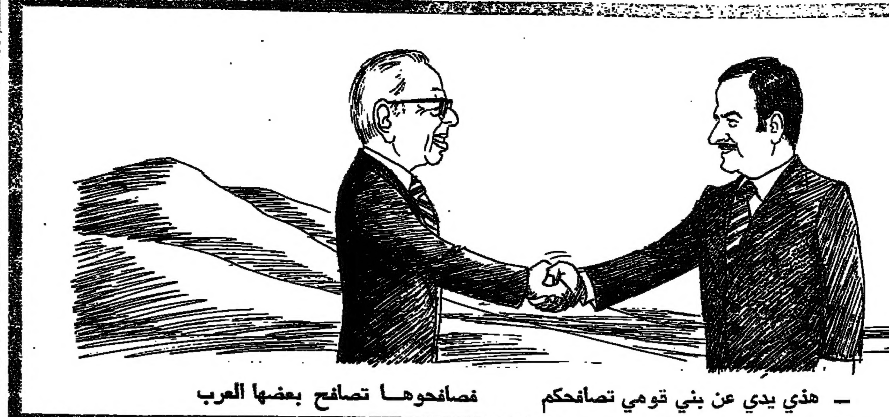
هذه يدي عن بني قومي تصافحكم - تصافحوها تصافح بعضها العرب